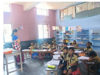
Klassenzimmer von innen